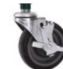
RO-ACC-WS-CAST5B Roue 5" avec frein tige ronde pour étagère en fil métallique